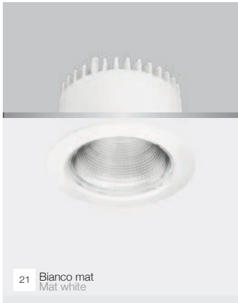
21 Bianco mat Mat white