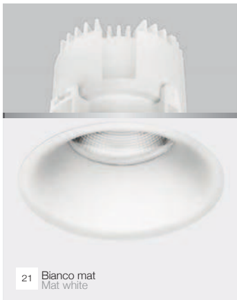
21 Bianco mat Mat white