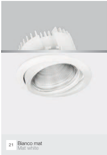
21 Bianco mat Mat white